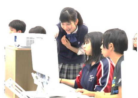
総合ビジネス科 表計算で分析しよう

8月27日(火)、体験入学が行われ、当日は中学生・引率の先生・保護者計190名の参加がありました。在校生による学科紹介、7つのコースに分かれての体験実習、部活動体験と続きました。