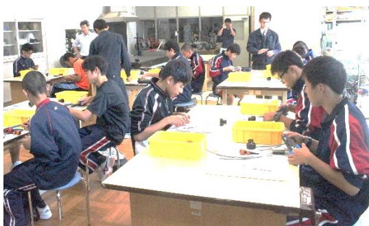
電気システム科 センサを使った電子制御