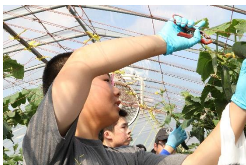
園芸科学科 グリーンライフ