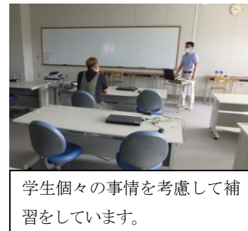
学生個々の事情を考慮して補習をしています。

また、出席時数不足とは別に、受講できなかった講義は、希望があれば個別に補習を行っています。