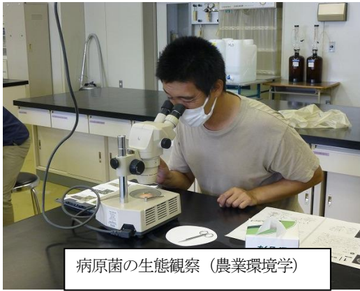
病原菌の生態観察 (農業環境学)

いよいよ登校学習が本格化！ 農繁期も終わり11月に入ると、専攻科では登校学習が本格化します。およそ年間70日の登校日数のうち、これからの期間に40日の登校日が設定されています。土壌肥料や作物、環境、機械、簿記、経済などこれらの自家経営に必要な知識やスキルを集中して学ぶこととなります。