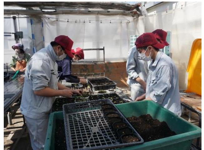
マリーゴールドの鉢上げ実習【園芸2年】

昨年度に引き続き、4/30、5/1の事前注文を受け付けた方のみを対象に苗の引き換えを行います。すでに注文受付は終了しております。ご案内が行き届かなかった皆様には本当に申し訳ございません。販売実習当日の混乱を避けるためにも、これからも同じ形式で実施させていただきますことをご了承ください。