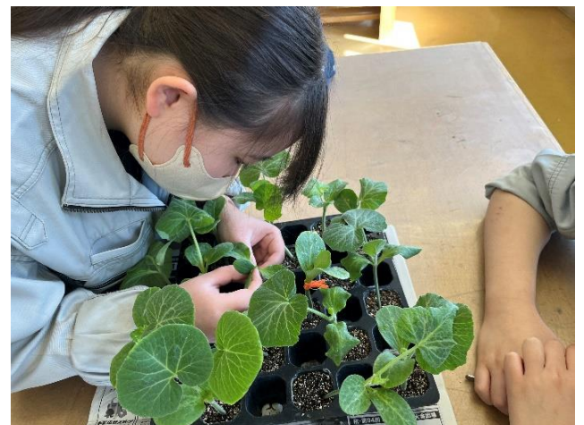
キュウリの接ぎ木実習【園芸3年】