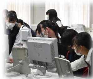
表 計 算