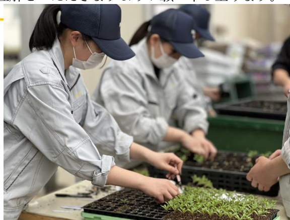
マリーゴールドの鉢上げ実習【園芸2年】上 メロンの摘心実習【園芸3年】下

生徒とお客様の感染防止・予防と安全確保のため、どうぞご理解をいただきますようお願い申し上げます。